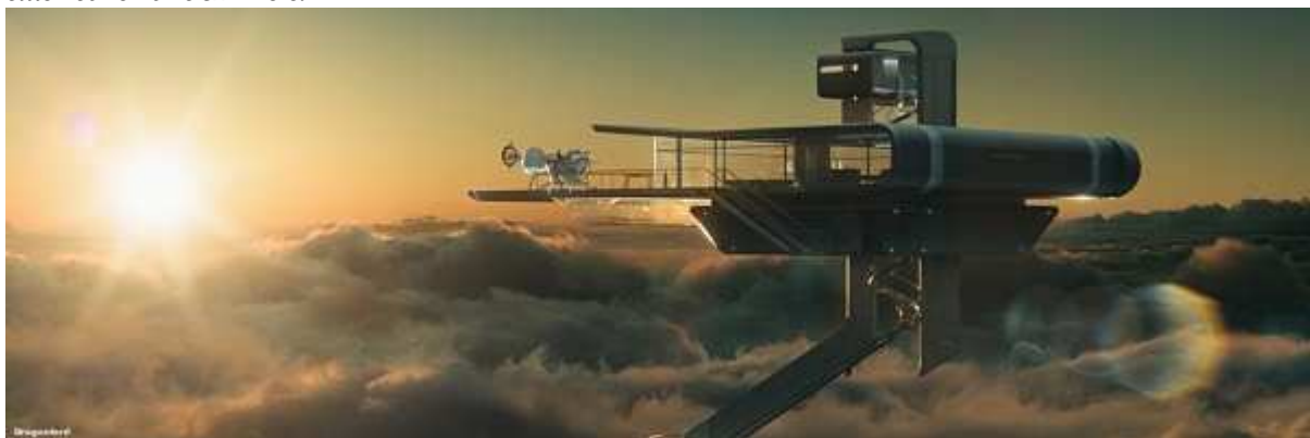
A Sky tower egy gyönyörű, felhők feletti, panorámás épület.

A film nagyszerű vizuális elemekkel szolgál a nézőknek, különböző nevezetességek alig felismerhető romjai emelkednek a felszín fölé.